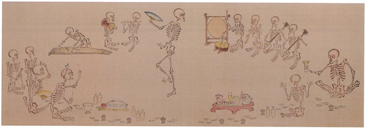
骸骨のうたげ(金性寺)

江戸時代から明治時代にかけて盛んに描かれた幽霊画。日本画や浮世絵の様式のひとつとして、死者の魂や幽霊を描いたこのジャンルは、あらゆる絵画の中でも最も難しい技法ともいわれます。その性格から寺院で所蔵する作品も多く、お盆・彼岸などの法会の折に六道絵や九相図などとともに開帳されました。そこには、単に死者の霊を描いた美術品としての性格だけでなく、その地域独自の風習・信仰が取り込まれています。