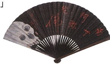
鉄扇・骸骨と幽霊(金性寺)